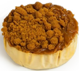
Tarta de queso galleta Lotus Biscoff