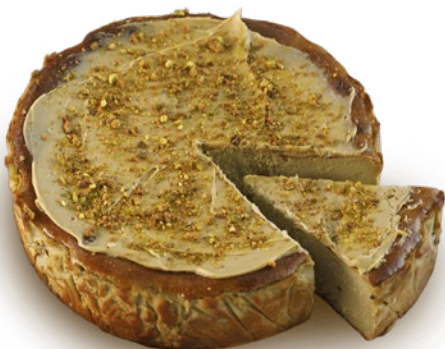
Tarta de queso de pistacho