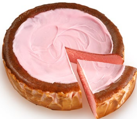
Tarta de queso rosa