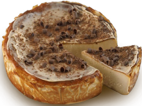
Tarta de queso de crema de avellanas