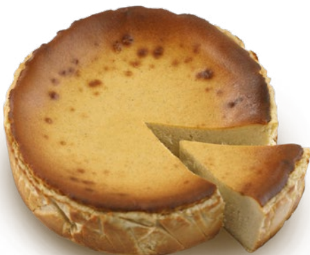
Tarta de queso de chocolate blanco y vainilla