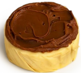
Tarta de queso clásica con dulce de leche