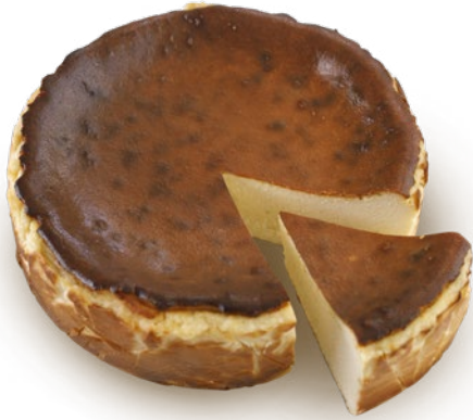
Tarta de queso clásica