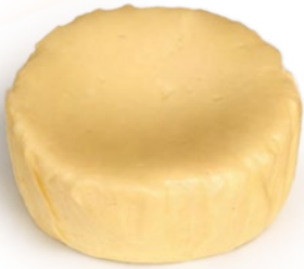
Tarta de queso clásica