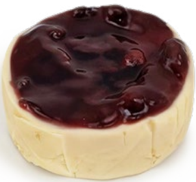
Tarta de queso clásica con frutos rojos