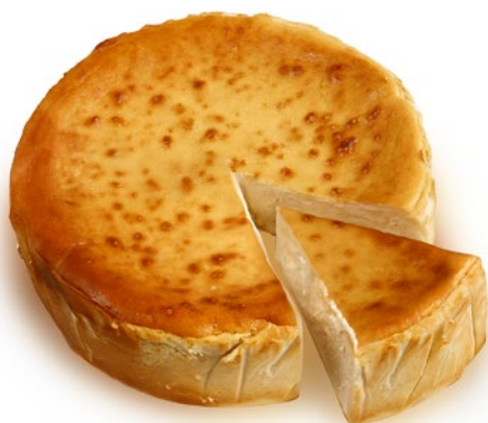
Tarta de queso de turrón IGP