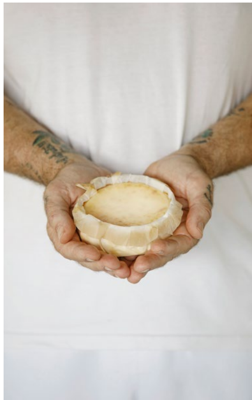
10 cm | 220 g