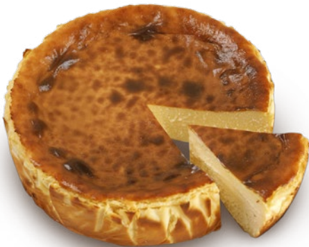
Tarta de queso tradicional