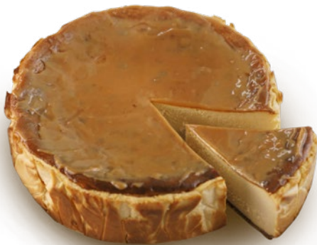
Tarta de queso toffee caramel