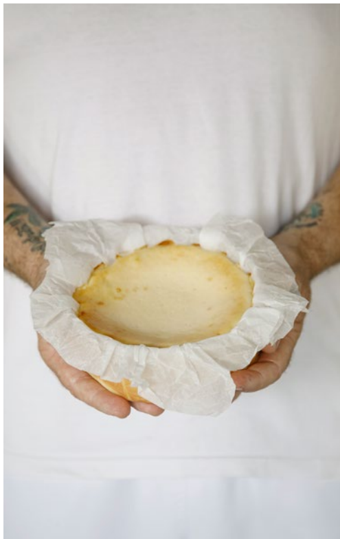
15 cm | 750 g

Cada uno de ellos está pensado para brindarte la flexibilidad y funcionalidad que necesitas, permitiéndote optimizar tus procesos, mejorar la experiencia de tus clientes y potenciar tus resultados. Tú eliges la opción que mejor se ajusta a tus objetivos, y nosotros te acompañamos en cada paso del camino.