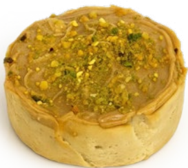
Tarta de queso de pistacho