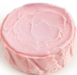
Tarta de queso rosa