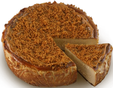
Tarta de queso galleta Lotus Biscoff