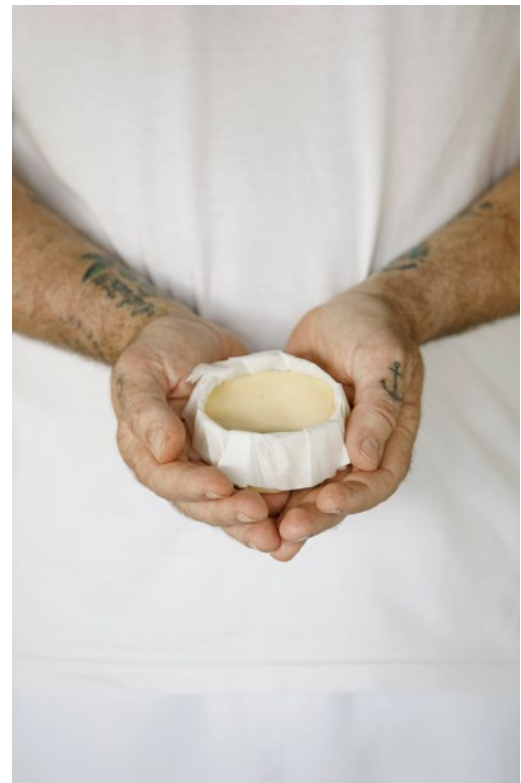
7 cm | 115 g